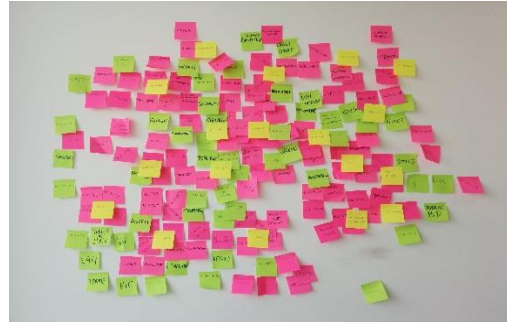
Photo n°2 : Photographie prise par Solène Borrat, Paris, 12 mars 2015 - Crédit : User studio